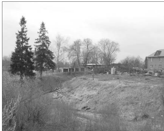
Слева храм Воздвижения Креста Господня в селе Телепнево. Фото 1941 года из архива музея «Новый Иерусалим». Справа современный снимок того же места. Фото Сергея Носикова.

В конце XVI века село Телепнево с деревянной церковью Воздвижения Креста Господня находилось во владении Московского Новинского монастыря. В Смутное время церковь была разрушена, но уже в 1643 году в селе возвели новый деревянный храм того же посвящения. В 1690 году храм был снова перестроен. Сохранилась благословенная грамота на строительство: « В селе Телепневе подле старой церкви построить новую во имя Воздвижения честнаго Креста Господня, а верх на той церкви велеть сделать по чину против прочих деревянных церквей, а не шатровой, а олтарь делать круглой, тройной ».