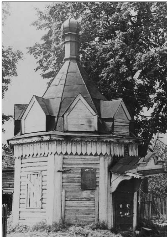
Часовня в деревне Холщевики.