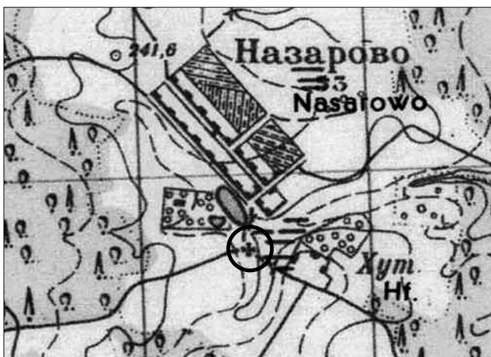
Отметка Троицкого храма на карте 1940 года

Судьба Троицкой церкви в первые годы после революции пока не выяснена. Сохранился лишь документ конца 1920-х годов, полученный Новопетровским волисполкомом: