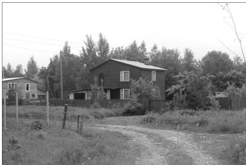
Частный участок на месте бывшего Троицкого храма