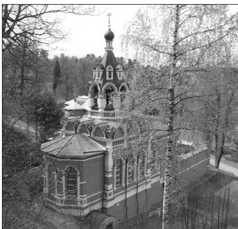
Церковь Саввы Сторожевского в Саввинском скиту, устроенная над пещерой Преподобного