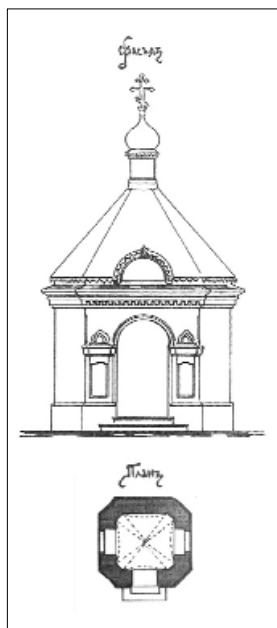
Часовня у церкви.