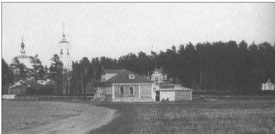
Сохранившаяся до наших дней арка кладбища (справа) и Успенский храм (слева). Фото из книги «Суконщики Поповы...»