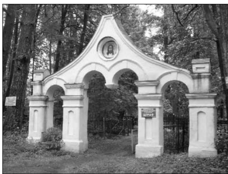
Сохранившаяся до наших дней арка кладбища

Осенью 2012 года местными жителями неподалеку от места бывшего Успенского храма был установлен большой деревянный крест.