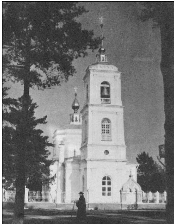
Церковь Успения Божией Матери в селе Ивановское. Фото конца XIX века из книги «Описание Успенской, что при Ивановской фабрике, церкви»

Успенский храм был заложен 25 июля 1864 года с благословения и разрешения митрополита Московского Филарета. Земля для постройки церкви и домов причта была «без всякого прекословия и вознаграждения» (бесплатно) выделена крестьянами деревни Ивановской «количеством 7 десятин и 200 саженей и сверх того 1 десятина для кладбища». Спустя четыре года «каменный храм с та-