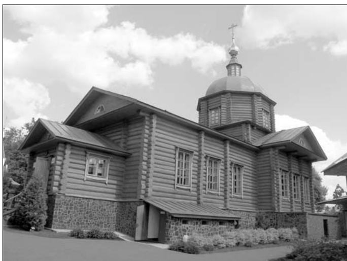
Казанский храм в городе Егорьевск. Примерно так выглядела церковь в Мушкине