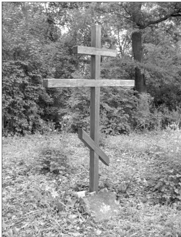
Деревянный крест на месте храма Живоначальной Троицы на погосте Мушкино