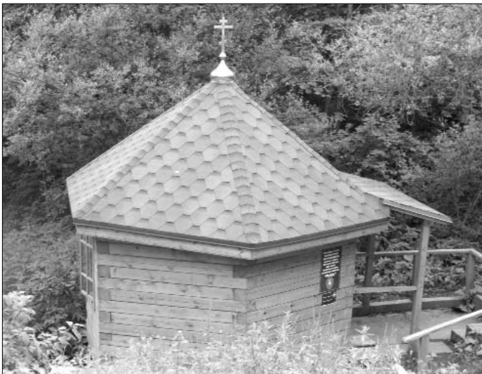
Часовня Георгия Победоносца в селе Троицкое на святом источнике. Современное фото

Обращаем внимание, что оба святых изображены вместе, что не часто встречается на иконах. Думается, что такая икона оказалась не случайно в небольшой приходской церкви. Известно, что Савва был учеником Сергия Радонежского и что в окрестностях Звенигорода, до которого от Троицкого около 20 верст, он основал обитель, ныне называемую Саввино-Сторожевским монастырем. Может предание о том, что Сергей Радонежский бывал в этих местах как-то связано с его учеником?