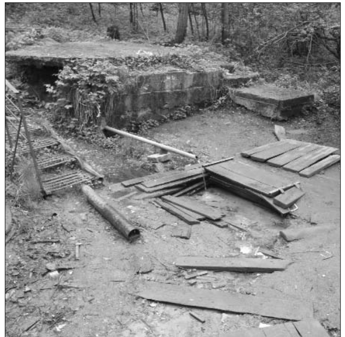
Источник у речки Пересалки вблизи деревни Борисово. Современное фото