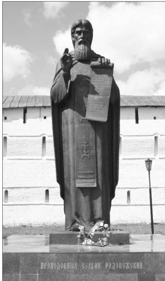
Памятник Преподобному в Сергиевом Посаде. Современное фото

Первое место – село Троицкое на Истре, иначе называемое Троицкий погост. «Предание гласит, что когда-то проходил этими лесами святой Сергий Радонежский и остановился отдохнуть. Забил по его молитве на том месте родник, а через некоторое время вырос и храм во имя Святой Троицы. Принято считать, что существующий ныне деревянный храм погоста построен в 1675 году, а до этого церкви не было. Но это не противоречит преданию: первый храм тут мог быть упразднен гораздо ранее, а