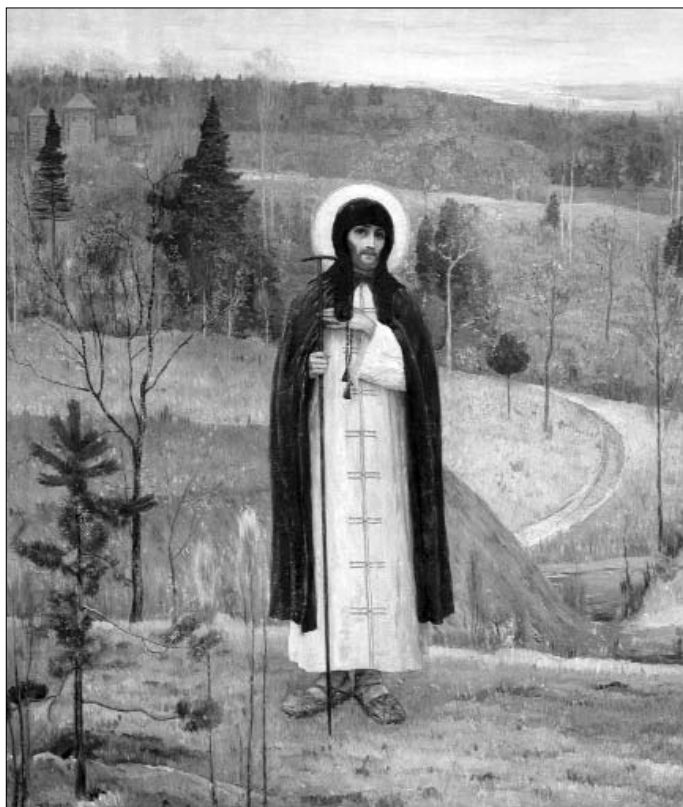
Михаил Васильевич Нестеров. Преподобный Сергий Радонежский. 1899 год

Да, действительно, это место почти идеально подходит под описание: там имеется довольно глубокий овраг с высокими склонами, по которому течет речка Пересалка, неподалеку растут большие хвойные деревья (в основном сосны, но есть и ели), а на склоне оврага, на горке находится деревня Борисово. Правда, на роднике ныне нет колодца и сруба, нет никаких икон. Да и по прямой от монастыря до источника 2,8 километра (по дороге будут все три), то есть в полтора раза больше указанных в описании «в двух километрах от Аносино». Но, думается, такая погрешность в нашем случае вполне