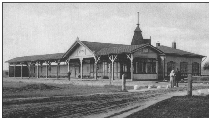
Станции Манихино (слева) и Истра. Фото начала XX века

станции «Манихино» Виндавской железной дороги икону Спасителя в дубовом киоте за стеклом. Из донесения местного благочинного видно, что место для постановки иконы в правом углу при входе в зал 3 класса вполне приличное и удобное. Следует только внушить жертвователю, чтобы он сделал железную решетку или барьер для охранения иконы от прикосновения посторонними посетителями и на некотором расстоянии, дабы мог поместиться подсвечник или лампада, на каковое дело жертвователь по его мнению будет согласен». На это последовала положительная резолюция.