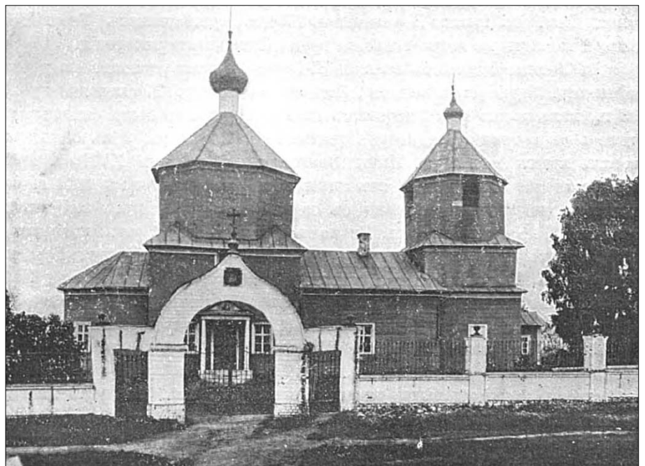
Храм Преображения Господня в селе Никулино. Фото начала XX века из книги «Спутник по Московско-Виндавской железной дороге»

консисторию прошение о постройке нового храма: «Сего 1781 года минушаго июля 27 числа по власти Божией помянутая Преображенская церковь незатным случаем згорела без остатку, от чего мы именованные лишились слышания Славословия Бо-