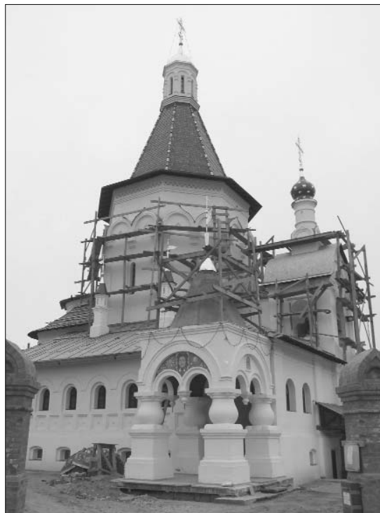
Строящийся Никольский храм в селе Никулино. Современное фото

На месте сгоревшего Преображенского храма в Никулине в советские годы находился сельский клуб, который в 1994 году разрушили, а затем верующие установили на этом месте деревянный крест в надежде на возрождение храма. В августе 2000 года был зарегистрирован приход Никольской церкви села Никулино, которому выделили земельный участок под строительство общей площадью 1000 квадратных метров. Тогда же была оборудована временная деревянная церковь, в которой еженедельно совершались молебны.