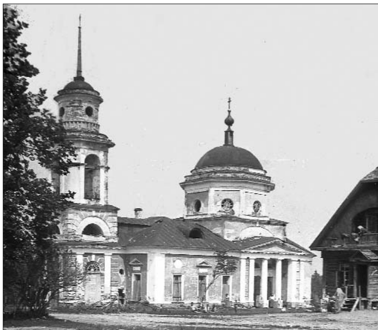
Храм Рождества Богородицы в селе Александрово. Май 1941 года.